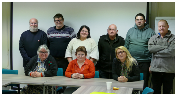
Le comité de rédaction du "Mag' des Protégés"

Cette gazette et son contenu ont été imaginés et créés par des majeurs protégés.